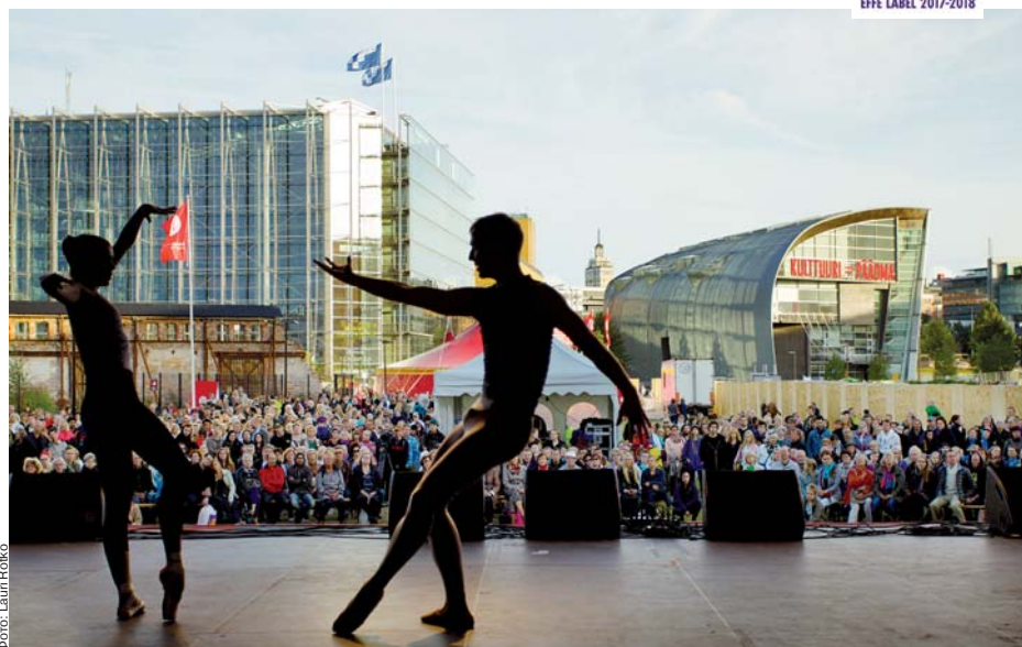
Фото: Lauri Riekko